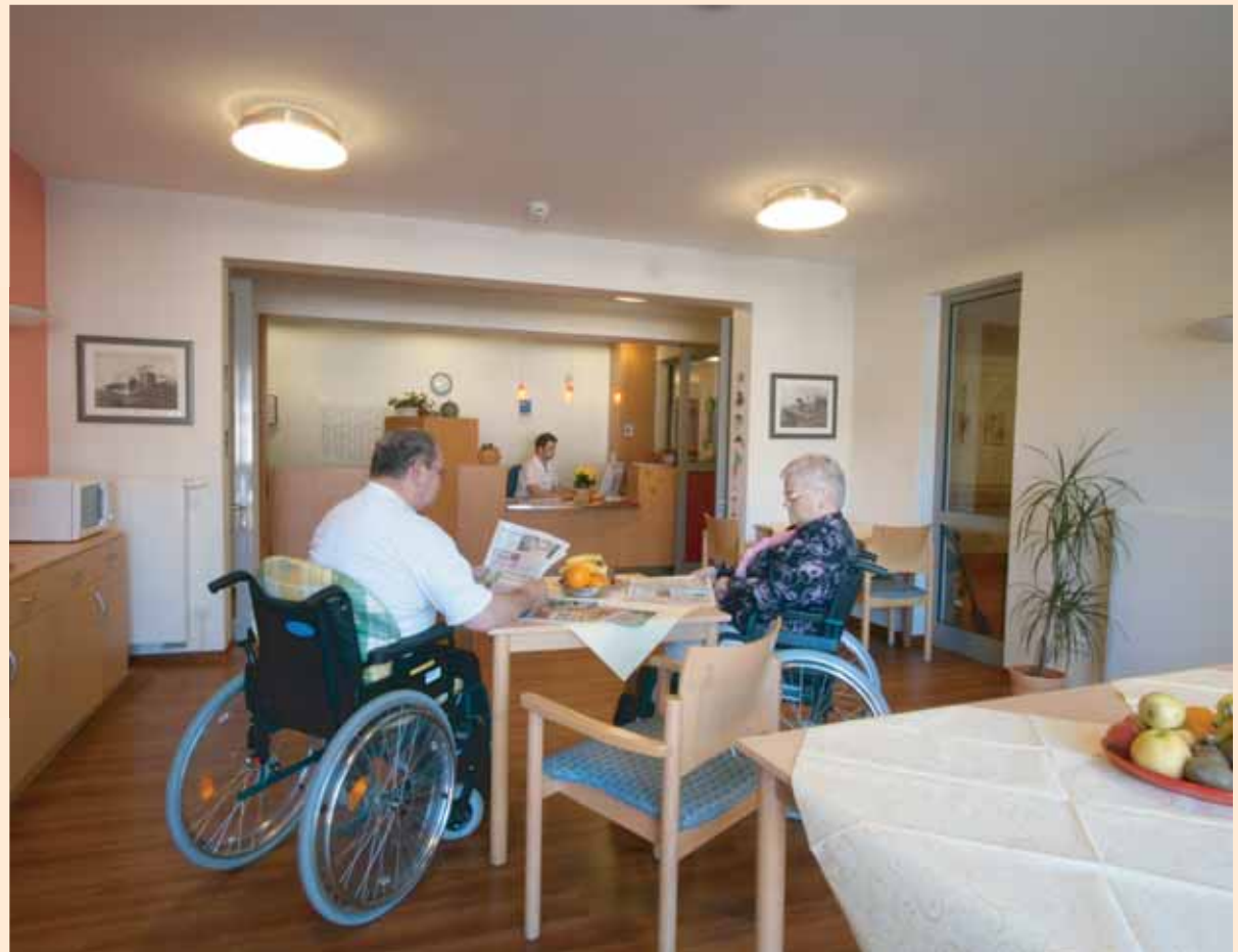
Offenes Miteinander: Die Mitarbeiter haben ihren Arbeitsplatz im Aufenthaltsraum der Bewohner. So sind sie ansprechbar und schnell zur Stelle, wenn sie gebraucht werden.

Ganz entspannt baden in unvergleichlicher Wohlfühl-Atmosphäre – im Haus Zuflucht haben auch schwerstpflegebedürftige Bewohner diese Möglichkeit. Mit viel Geschmack, moderner Technik und vor allem an den Bedürfnissen der Menschen orientiert ist nicht nur das Bad eingerichtet, sondern der gesamte Pflegebereich. Aktuelle wissenschaftliche Erkenntnisse fließen ebenso selbstverständlich in unsere Pflege ein wie die persönliche Zuwendung und menschliche Wärme.