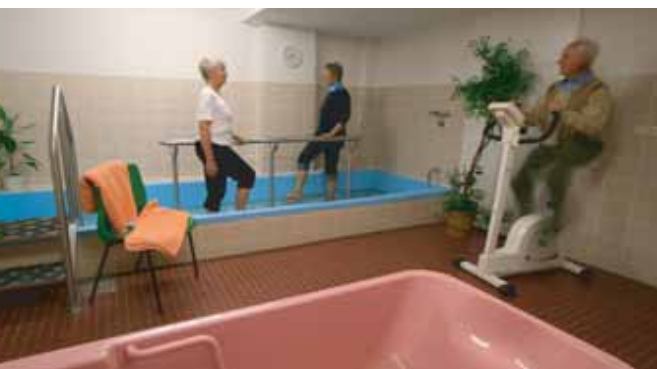
Friseursalon und Kneippbecken