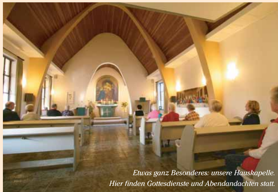
Etwas ganz Besonderes: unsere Hauskapelle. Hier finden Gottesdienste und Abendandachten statt.