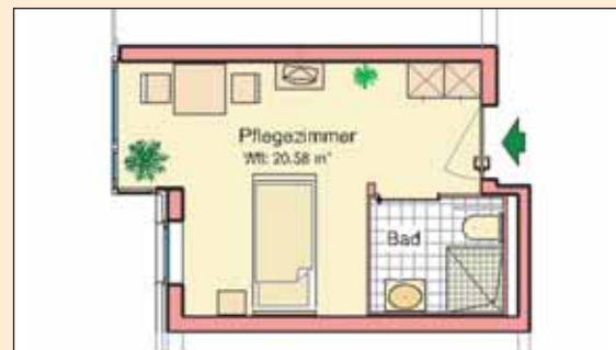
Beispiel: Pflegezimmer im Fichtenhäus