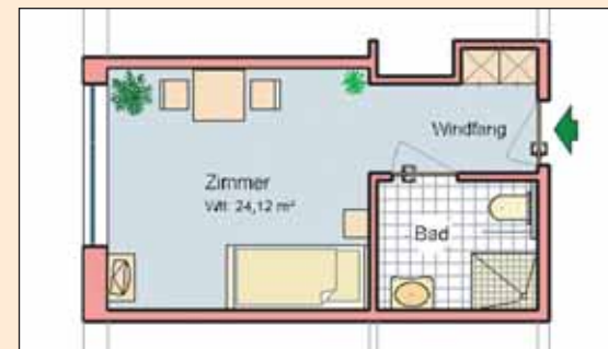
Beispiel: Wohnung im Haupthaus