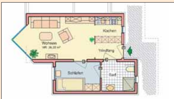
Beispiel: 1,5 Zimmer-Apartment im Drei Tannenhäus