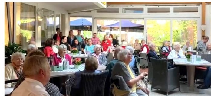
Tolle Stimmung beim Abschiedsfest im Wintergarten