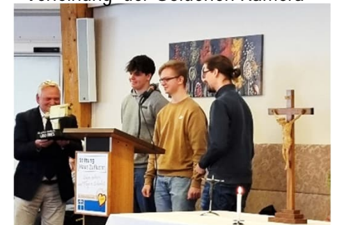
Tschüss, Herr Fries