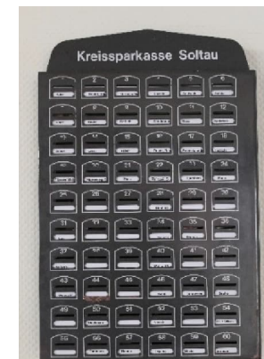
Unser Sparfach am Markt

Wir freuen uns schon jetzt auf das nächste Mal und darauf, diese besonderen Momente erneut zu erleben.