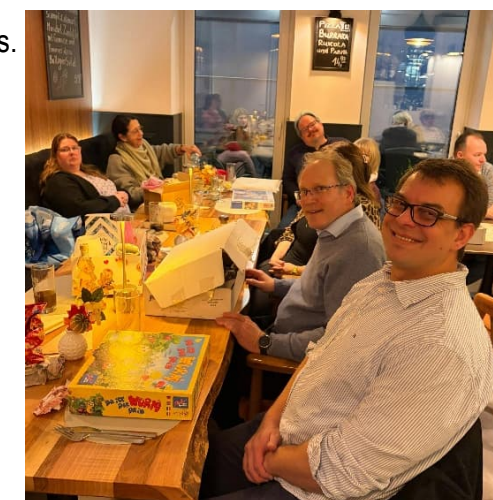
Die fleissigen Sparer in netter Runde