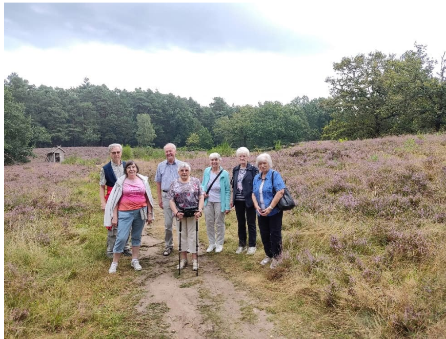
Die Nordic-Walking-Gruppe im Herbst in der Heide