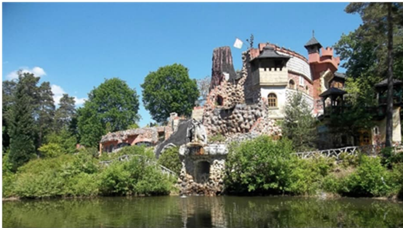
Das Kastell der Iserhatsche beherbergt den Schloßsaal