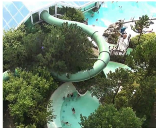
Das Erlebnisbad des Center Parc mit Outdoor-Rutsche